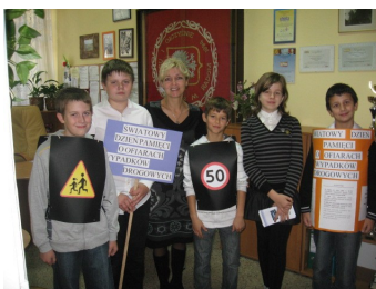
OGÓLNOPOLSKA AKCJA „WYPADKI NA DROGACH – POROZMAWIAMY”