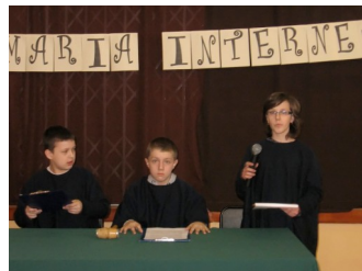
DZIEŃ BEZPIECZNEGO INTERNETU