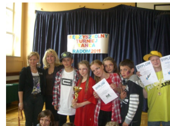
MIĘDZYSZKOLNY TURNIEJ TAŃCA