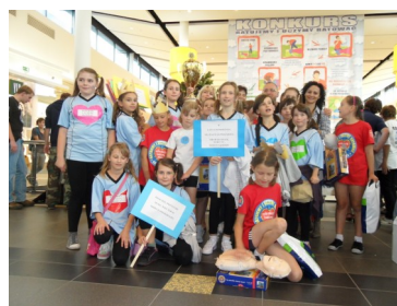
AKCJE ZWIĄZANE Z BRD

Np.. I miejsce z mazowieckim „Ratujemy i uczymy ratować”