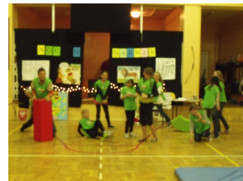
NOC W NARNII, NOC Z HARRYM POTTEREM