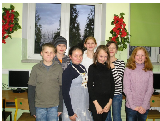
Zespół redakcyjny w roku szkolnym 2011/2012