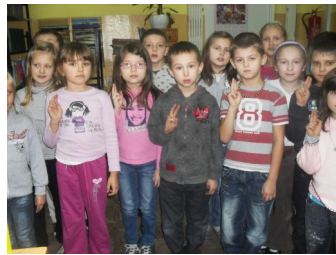
PASOWANIE NA CZYTELNIKA