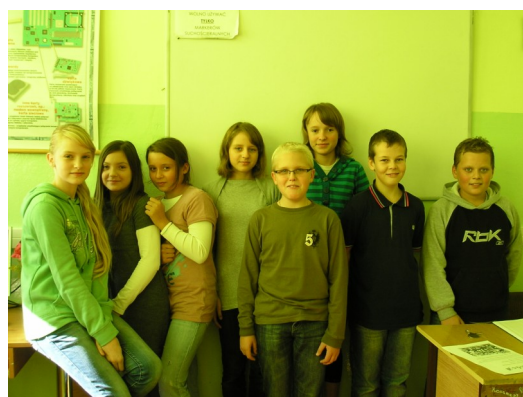
Zespół redakcyjny w roku szkolnym 2010/2011